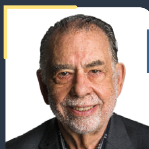
Francis Ford Coppola

Ex presidenta y consejera delegada de Hewlett-Packard Company